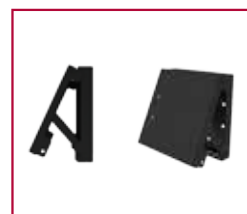
Zugang durch Herausziehen