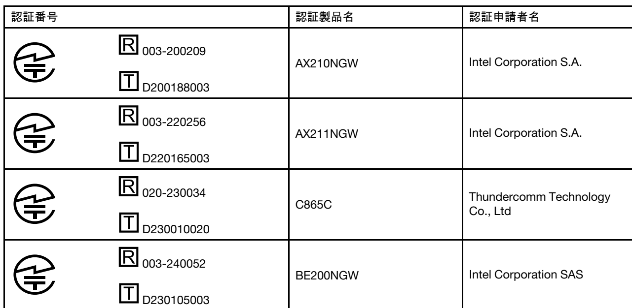
Table 1. 無線LAN / Bluetooth アダプター

本製品が装備する無線アダプターは、電波法および電気通信事業法により技術基準認証を下記のとおり取得しています。本製品に組み込まれた無線設備を他の機器で使用する場合は、当該機器が上記と同じく認証を受けていることをご確認ください。認証されていない機器での使用は、電波法の規定により認められていません。