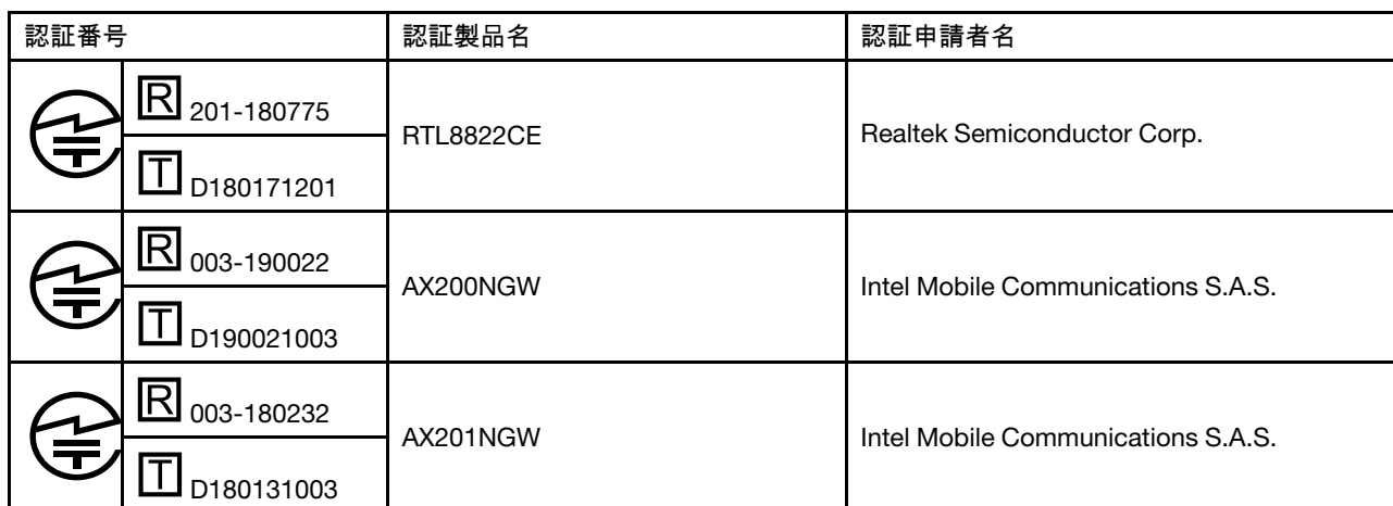
Table 1. 無線LAN / Bluetooth アダプターが搭載されているモデル

本製品が装備する無線アダプターは、電波法および電気通信事業法により技術基準認証を下記のとおり取得しています。本製品に組み込まれた無線設備を他の機器で使用する場合は、当該機器が上記と同じく認証を受けていることをご確認ください。認証されていない機器での使用は、電波法の規定により認められていません。