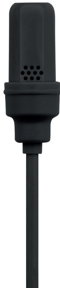
UL4B Micro cravate directionnel miniature UniPlex (noir)