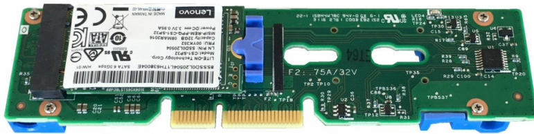
Figure 3. Single M.2 Adapter and a 32 GB M.2 drive

The Single M.2 Adapter is shown in the following photo, with the 32GB M.2 drive installed.