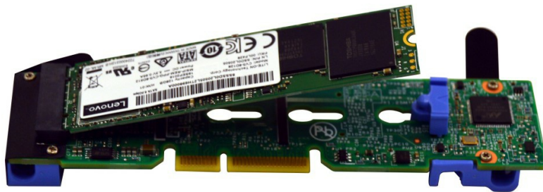
Figure 1. Dual M.2 Adapter and a 128 GB M.2 drive

One example is the Dual M.2 Adapter, as shown in the following figure, with one 128GB M.2 drive partially inserted. The second M.2 drive is installed on the other side of the adapter.