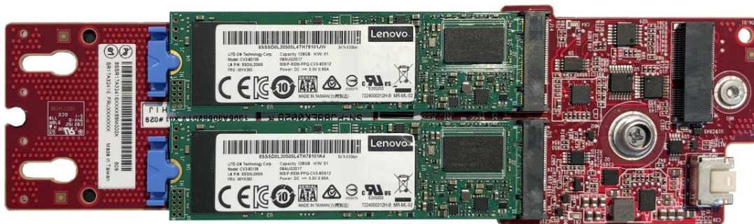
Figure 4. SATA/NVMe M.2 Module with 2 drives

The following figure shows the SATA/NVMe M.2 Module with two 128 GB M.2 drives installed. Note that the production M.2 Module has a green circuit board, not the red color as shown here.