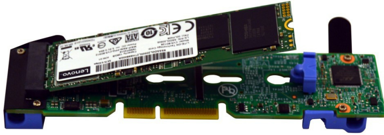
Figure 2. Dual M.2 Adapter and a 128 GB M.2 drive

The Single M.2 Adapter is shown in the following photo, with the 32GB M.2 drive installed.