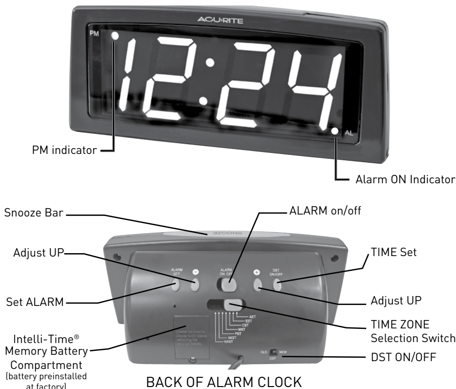
BACK OF ALARM CLOCK